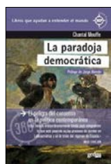
La paradoja democrática Chantal Mouffe 978-84-16572-35-9