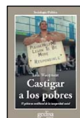
Castigar a los pobres Loic Wacquant 978-84-9784-155-9