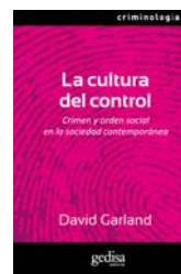
La cultura del control. Crimen y orden social en la sociedad contemporánea David Garland 84-9784-040-2