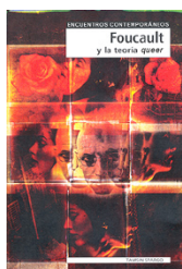
Foucault y la teoría del queer Tamsin Spargo 978-84-9784-050-7