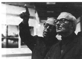
Con el arquitecto Josep Lluís Sert, creador del edificio de la Fundació Miró.